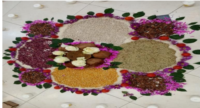
Figure 5: Mandala

piensa y lo que siente y una vez reconocidas, se pueden considerar como un producto a entregar a la sociedad.