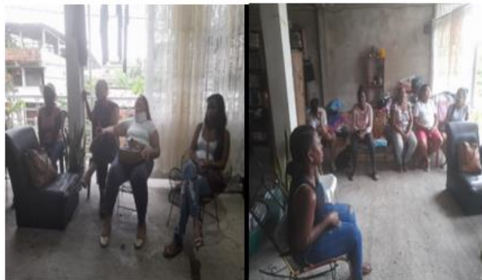
Figure 2: Presentación de pasantes a la agrupación Yerba Buena

Durante: Documentación de los talleres de Producción audiovisual y el taller Encuentros y resonancias.