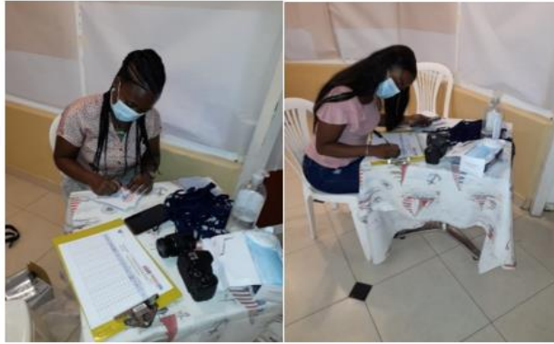
Figure 3: Proceso de relatoría

culturales como las creencias, los valores y hábitos del diario vivir, que propició la reconstrucción del proceso vivido.