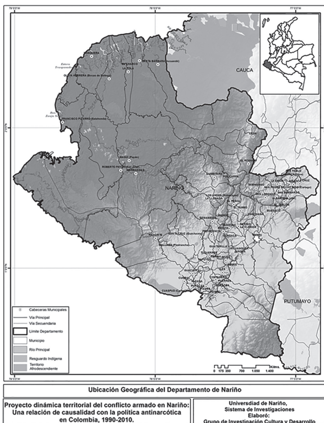
Mapa 1. Ubicación Geográfica del Departamento de Nariño.

En general, los escasos estudios de la región, han permitido una lectura de la violencia no consecuente con la realidad geográfica y más bien se centran en visiones muy subjetivizadas por los investigadores.